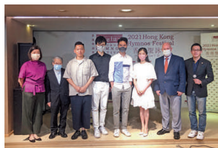
首屆香港聖詠節發布會現場合照。

活動將在香港大會堂、香港文化中心、九龍華仁書院、明愛專上學院等地舉辦，門票十月起在城市售票網發售，詳情可瀏覽網址www.hkhymnosfestival.org。