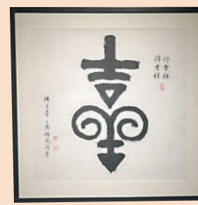
山海藝術中心展出作品《吉祥》。