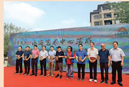
山海藝術中心舉行落成典禮。